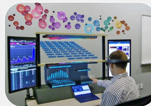
مدل بانکداری پلتفرمی (BaaSP)