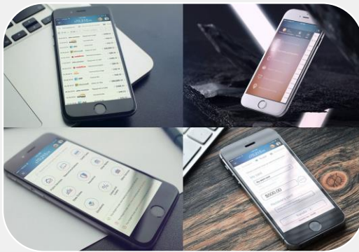
مدل بانکداری نوین (BaaS)