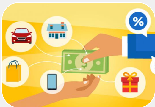
مدل بانکداری سنتی Spread & Fee Based